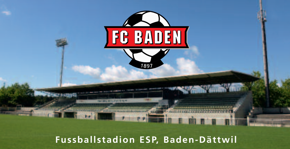
Fussballstadion ESP, Baden-Dättwil