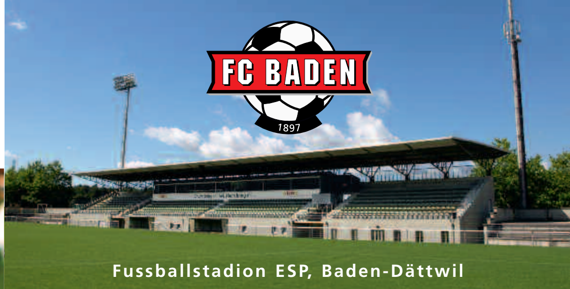
Fussballstadion ESP, Baden-Dättwil