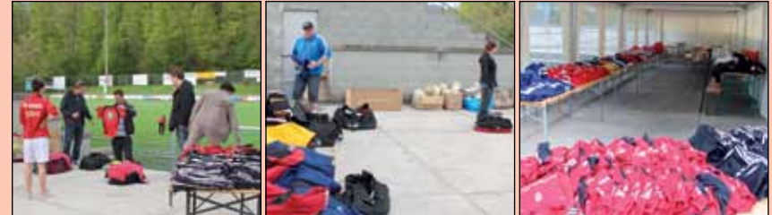
Der FC Baden leistet Entwicklungshilfe und unterstützt verschiedene Hilfswerke und ein von Schweizern gegründetes und geleitetes Fussball-Camp auf der Insel Santiago.

«Offizieller Ausrüster» FC Baden/Team Limmattal