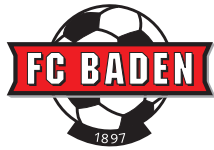
Robin Gloor wird unterstützt von: